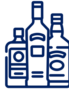
Alimentos y Bebidas