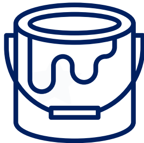
Colorantes y Pinturas