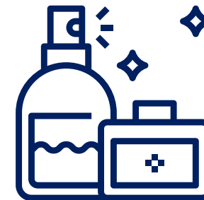
Perfumes y Cosméticos